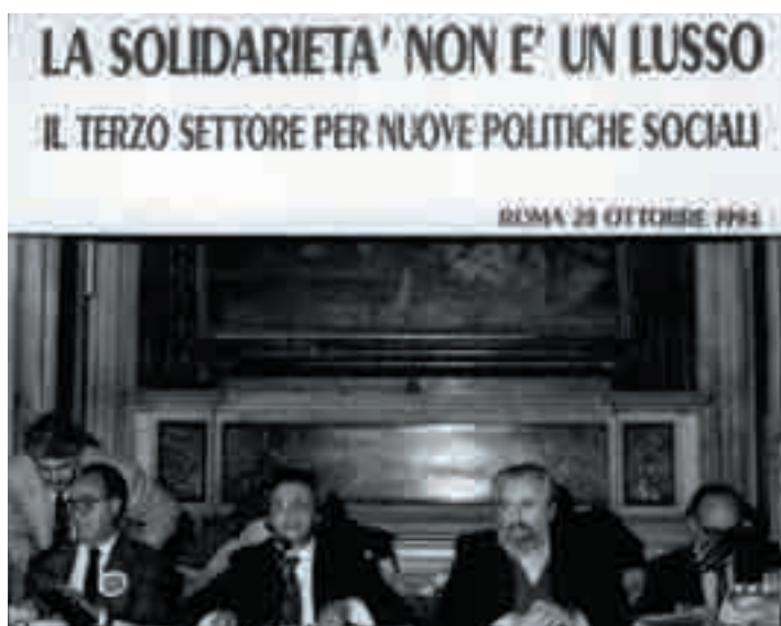
La nascita del Forum del Terzo settore

D urante la presidenza Passuello le Acli verranno a caratterizzarsi sempre di più come associazioni di Terzo settore, facendosi forza trainante di una realtà molto variegata e complessa che emerge agli inizi degli anni '90 come nuovo attore di democrazia e di economia sociale. Nel maggio 1994 nasce il Forum del Terzo settore, la cui costituzione ufficiale sarà un processo lungo e laborioso che si concluderà il 19 giugno 1997, a Roma, presso la sede nazionale delle Acli di via Marcora. Subito dopo si sviluppano molte iniziative del non profit italiano come Banca Etica, Aster-X, Transfair, ecc. Alla nascita del Terzo settore e alla sua crescente soggettività politica, Franco Passuello dedicherà un suo libro-intervista in cui si afferma che: «Questo movimento non può essere affare dello stato e tanto meno del mercato. Può essere solo compito della società civile. Ecco perché la riforma dello stato sociale è anche, e prima di tutto, un problema di riforma culturale e di riforma della società» (F. Passuello, Una nuova frontiera: il Terzo settore , Edizioni Lavoro, Roma 1997, p. 135).