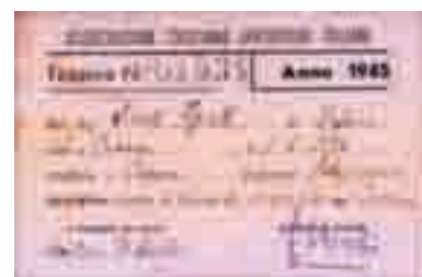
Tessera del 1945

È sicuro che le Acli erano già virtualmente esistenti prima ancora di essere fondate. Quando si pensa al rapporto tra la fede e il lavoro, quando la Chiesa affronta la "questione sociale", quando si fa strada l'elaborazione della dottrina sociale... possiamo dire che già si stanno ponendo le basi per la nascita delle Acli. Così quando nel quarto Congresso cattolico italiano del lontano 1877 si afferma-