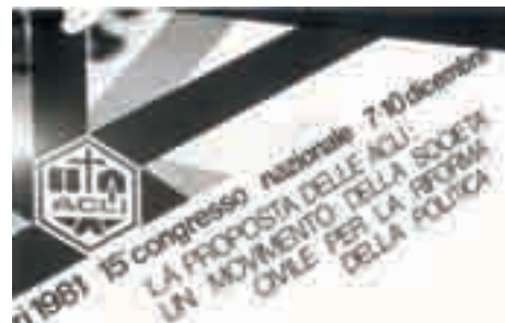
Congresso nazionale, Bari 7-10 dicembre 1981

Forte di questa esperienza, il Congresso di Bari (7-10 dicembre 1981) – a cui giunge anche un messaggio del pontefice Giovanni Paolo II – si appunta sulla costruzione di “un movimento della società civile per la riforma della politica” , che si muova lungo le direttrici della pace , della pianificazione globale (ridisegnare un quadro coordinato e finalizzato di interventi volti a rendere più equilibrato e meno precario il futuro soprattutto in relazione al fenomeno grave della disoccupazione); e della diffusione dei poteri (l'esperienza delle campagne per la casa, per la salute ecc.). Tre impegni puntualmente sviluppati nel triennio successivo, mentre si elabora l'idea della “convenzione” di soggetti sociali come articolazione del “movimento della società civile”.