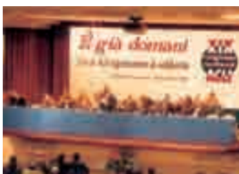
Chianciano, 8-11 dicembre 1993, XIX Congresso nazionale

Dopo la crisi radicale di tangentopoli e la stagione di svolta dovuta a "mani pulite", Giovanni Bianchi intuisce che anche le Acli sono chiamate a ripensarsi. Nel Congresso straordinario di "rifondazione", tenuto a Chianciano l'8-11 dicembre 1993, si apre una fase costituente che si concluderà con il successivo congresso ordinario. Ma tale rifondazione si realizzerà nel tempo essenzialmente come una rigenerazione culturale. Le Acli vedranno nella "Costituenti dei cattolici democratici" l'area del loro radicamento politico. «Fu coerente a questa prospettiva la stessa scelta (non interpretabile in senso strettamente personale) di Giovanni Bianchi all'inizio del 1994 di lasciare la presidenza per candidarsi alle elezioni nel nuovo Partito popolare, di cui diverrà poi Presidente del Consiglio nazionale». (Guido Formigoni, "Aggiornamenti Sociali", 1995).