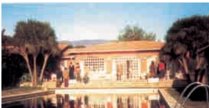
Lariano (Rm), il Centro di Formazione Acli "Marino Carboni"

A l XVII Congresso nazionale di Milano (30/1 - 2/2-1988) Giovanni Bianchi, intuendo la profondità e la rapidità delle trasformazioni culturali, economiche e sociali in atto, dichiara che, in questa fase di passaggio, è possibile per le Acli cominciare a scrivere una storia diversa, basata su una responsabilità etica del civile che vuole più Stato ma meno assistenza, e maggiore autonomia che non sia disgiunta da un orizzonte di etica collettiva. Lo "scettro" deve tornare nelle mani del cittadino, vero arbitro della vita democratica.