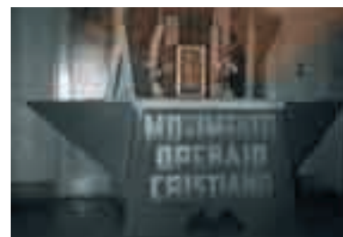
L'altare donato dagli aclisti, nel 1961, a mons. Montini

Il Comitato esecutivo delle Acli, nel riconfermare la validità degli orientamenti e delle iniziative assunte dal Movimento per una più larga presa di coscienza da parte dei lavoratori di fronte ai problemi – intimamente collegati – dello sviluppo e della pace, fa proprio l'appello di Paolo VI e chiama i lavoratori aclisti ad accrescere il loro impegno culturale, politico e di solidarietà a sostegno delle attività di aiuto e di coope-