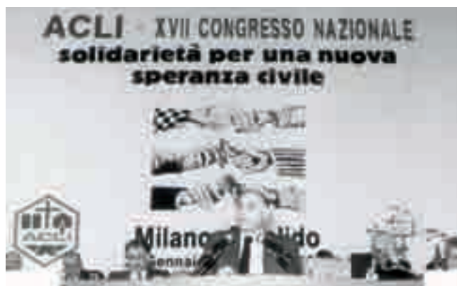
XVII Congresso nazionale, Milano 30 gennaio - 2 febbraio 1988