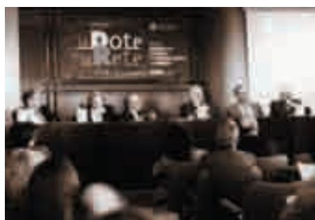
Bari, novembre 1997, Convegno Acli su "La Dote e la Rete"

C osa vuol dire "la dote e la rete"? Se i diritti di cittadinanza sono la dote , che dovrebbe essere garantita ad ognuno come appartenente ad una comunità, la rete è immagine dei nodi, delle articolazioni territoriali, delle relazioni organizzate che consentono ad un diritto di essere concretamente praticato. Su questo tema si svolge a Bari, nel novembre 1997, un importante convegno che rilancia la presenza delle Acli sul territorio come centri integrati di servizio.