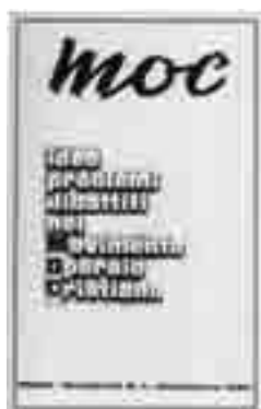
Il periodico "Moc"

C onsequenza diretta della frattura seguita al Congresso di Milano fu la nascita del periodico intitolato Moc , idee problemi dibattiti nel Movimento Operaio Cristiano e che faceva capo a Livio Labor.