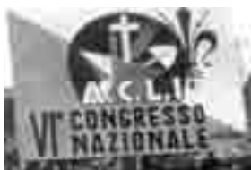
Firenze 1957: VI Congresso nazionale delle Acli