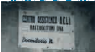
Uno dei primi "patronati": centro assistenza Acli per i raccoglitori uva