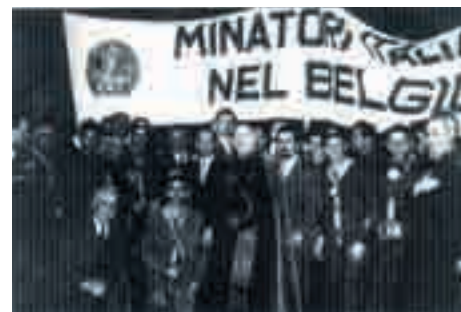
Minatori italiani "nel" Belgio

F in dai primi anni dalla loro nascita, le Acli sono emigrate insieme ai lavoratori italiani, radicandosi in quei Paesi dove i nostri connazionali si recavano in cerca di lavoro: Francia, Svizzera, Belgio, Germania. Le precarie condizioni lavorative, la lontananza dalla terra d'origine, spesso dalla famiglia, le difficoltà legate all'abitazione e al non essere accettati in società con culture diverse... erano i temi delle riflessioni di quegli anni, che nelle Acli si trasformavano da problemi e drammi personali in domande comuni, in analisi attente, in rivendicazioni sociali da rivolgere ai datori di lavoro, ai sindacati, alle istituzioni italiane e locali. (Sulla presenza delle Acli all'estero, si veda, Sonia Stefanovichj, a cura di, Le Acli in Europa e nel Mondo , Editoriale Aesse, Roma 2000).