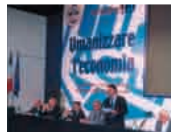
Vallombrosa - Convegno nazionale di studi "Umanizzare l'economia", 1999

Assumendo il paradigma dei diritti umani e dell'etica sociale, le