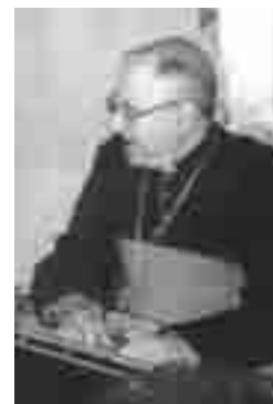
Card. Giuseppe Siri, Presidente della Cei