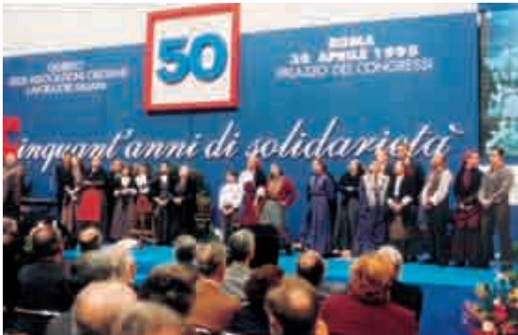
Roma, 30 aprile 1995, il Giubileo delle Acli

N el corso del 1995 le Acli celebrano il primo cinquantenario della propria fondazione. La memoria diventa una preziosa occasione per ripensare le ragioni della propria missione e dell'identità associativa.