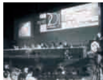
Congresso nazionale, Napoli, 28-31 marzo 1996

Dopo Napoli l'Associazione è impegnata a procedere in tre direzioni: essere un movimento della laicità cristiana matura; essere un movimento del lavoro e della cittadinanza solidale; essere un soggetto del Terzo settore e dell'economia sociale.