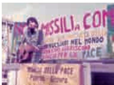
Marcia per la pace Palermo-Ginevra

La prima metà degli anni '80 vede le Acli fortemente impegnate sui temi della pace. Erano quelli gli anni della corsa agli armamenti e dell'installazione degli euromissili. Una grande iniziativa si svolse a Comiso il 4 aprile 1982 dove gli aclisti siciliani si impegnarono con una raccolta di firme contro i missili Cruise.