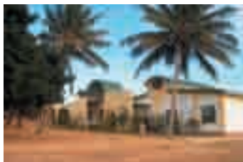
Mozambico, il centro di formazione professionale Acli "Estrela do Mar"

A l processo di globalizzazione si risponde non con la contrapposizione ma con la scelta di azioni positive per "globalizzare la solidarietà" (secondo il motivo new global "un altro mondo è possibile").