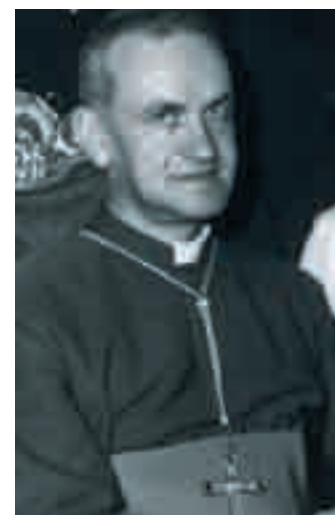
Card. Antonio Poma, presidente della Cei

Il 6 marzo 1970, esprimendo «perplessità» e turbamento per l'uso di linguaggi «incompatibili con la visione cristiana», il presidente della Cei, cardinale Antonio Poma consegna, a Emilio Gabaglio, una lettera con richiesta di chiarimenti su quattro punti: 1) Se le Acli "volevano ancora essere considerate movimento sociale dei lavoratori cristiani" (art.1 dello statuto); 2) se consideravano ancora obbligatoria la formazione integrale del lavoratore (art.2); 3) se intendevano "ancora avvalersi della presenza del sacerdote assistente"; 4) se assicuravano di tenere in debito conto i valori fondamentali dell'insegnamento sociale del cristianesimo.