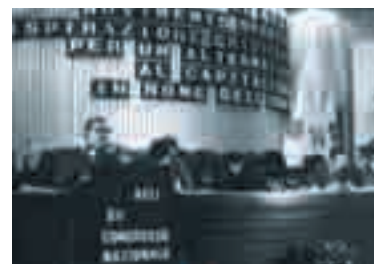
Cagliari, 13-16 aprile 1972: XII Congresso nazionale delle Acli

Il Congresso di Cagliari, 13-16 aprile 1972, ha il delicato compito di esprimere una chiarificazione circa l'identità e il ruolo delle Acli a seguito delle "ardue prove" vissute dopo il Congresso di Torino. Tema: "Le Acli, movimento operaio di ispirazione cristiana per una alternativa al capitalismo in nome dell'uomo". La decisione di maggior rilievo è l'approvazione all'unanimità dei primi due articoli statutari: «Le Acli fondano sul Messaggio Evangelico e sull'insegnamento della Chiesa la loro azione per la promozione della classe lavoratrice e organizzano i lavoratori cristiani che intendono contribuire alla costruzione di una nuova società in cui sia assicurato, secondo giustizia, lo sviluppo integrale dell'uomo» ( Atti del XII Congresso Na-