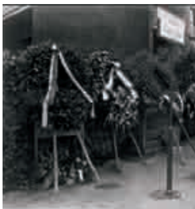
In memoria... Via Fani

A l Congresso nazionale di Bologna (15-18 giugno 1978), che si svolge sotto l'enorme impressione suscitata dal sequestro e uccisione di Aldo Moro, Rosati denuncia «tre bersagli delle Brigate rosse, nemici senza volto, dei quali non si conoscono i mandanti ma di cui si intuisce con sufficiente chiarezza il disegno di distruzione. Il primo bersaglio diretto e immediato è la Dc... Il secondo bersaglio è il Pci... Il terzo bersaglio sono le forze sociali e la società civile, nel senso che, bloccando il Paese sul dato dell'emergenza, il terrorismo cerca di annullare e disarticolare il tessuto vivo che completa la dimensione istituzionale e la dinamicità. L'attacco, in sintesi, era rivolto all'intero processo storico della democrazia italiana...» (D. Rosati, "L'Incudine e la Croce", 1994, p. 252).