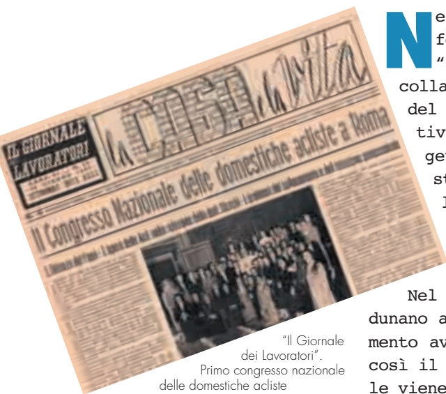
"Il Giornale dei lavoratori". Primo congresso nazionale delle domestiche acliste

N el convegno nazionale dell'11-15 agosto 1945 sul lavoro femminile, le Acli trattarono per la prima volta il tema "Il lavoro domestico e le addette ai lavori domestici", in collaborazione con le strutture della commissione femminile e del gruppo Acli domestiche. L'esigenza di intervenire era motivata da un duplice obiettivo: tutelare le donne che svolgevano un lavoro extra domestico e salvaguardare, nello stesso tempo, l'istituto familiare. La commissione centrale femminile, in particolare, assunse l'impegno di tutelare le lavoratrici domestiche indicando come soluzione del problema l'inserimento nelle famiglie di lavoratrici preparate moralmente e professionalmente.