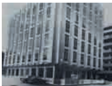
Roma, la "nuova" sede nazionale di Via Marcorà

Q uando le Acli nacquero la loro prima sede fu a Roma, in via Nazionale, presso gli uffici dell'Icas: una stanza, un telefono a mezzadria, una macchina da scrivere in prestito e, nel parco macchine, una bicicletta. Più tardi le Acli si trasferirono in altra sede in via dell'Ara Coeli.