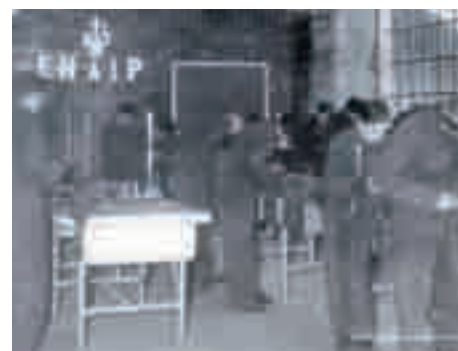
Enaip, formazione professionale a Longarone. Reparto meccanica

L'Enaip, con statuto proprio, viene costituito il 16 novembre 1951. Dieci anni dopo arriverà anche il riconoscimento giuridico a conclusione di un percorso di razionalizzazione, estensione e perfezionamento dell'iniziativa aclista nel vasto campo della formazione professionale.