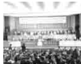
Milano 1959: VII Congresso nazionale delle Acli

Al Congresso di Milano (5-8/12/1959) fu approvato il principio della incompatibilità parlamentare ma si registrò una evidente contrapposizione tra la linea Labor (incompatibilità) e la linea Penazzato (favorevole però ad una deroga). L'assemblea congressuale fu invitata a procedere in due tempi. Con voto palese