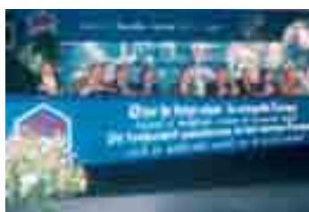
Bruxelles - XXI Congresso nazionale, 2000

Con il XXI Congresso nazionale di Bruxelles (30 marzo - 2 aprile 2000), dal titolo "Osare il futuro nella nuova Europa. Lavoro e solidarietà: radici dell'economia civile" - chiamato anche, "il Congresso del Giubileo" - le Acli si impegnano ad essere protagoniste a tutto campo della vita sociale e politica a livello nazionale, europeo e mondiale.