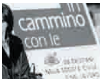
Assisi, novembre 1998, il manifesto della Conferenza organizzativa e programmatica

N ei giorni 5-8 novembre si tiene ad Assisi la Conferenza organizzativa e programmatica sul tema "In cammino con le Acli: da cristiani nella società civile e nel lavoro". Si cerca di indirizzare le strategie organizzative per realizzare la rigenerazione del movimento.