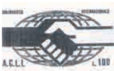
La tessera del "Fondo permanente di solidarietà internazionale delle Acli"

A nche per le Acli, come per tutti i movimenti ecclesiali, le scelte che matureranno negli anni del Concilio Vaticano II, portato a termine da Paolo VI nel 1965, rappresentarono un importante avvenimento di rigenerazione. Ci limiteremo a riportare qui un brano della mozione conclusiva del X Congresso nazionale di Roma (3-6 novembre 1966): «Il Concilio appena concluso ha riproposto una specifica responsabilità alla Chiesa ed ai cattolici e ha costituito un momento di riflessione e di proposta anche per tutti coloro che si riconoscono in un umanesimo personalista , basato sui valori fondamentali della libertà e della dignità di ogni singolo e di ogni gruppo sociale (...). Tali concetti, che le Acli riscoprono e ricevono dalla loro più piena fedeltà agli insegnamenti della Chiesa e del Concilio, sono patrimonio aperto a tutti i lavoratori italiani, indipendentemente dalla loro estrazione ideologica».