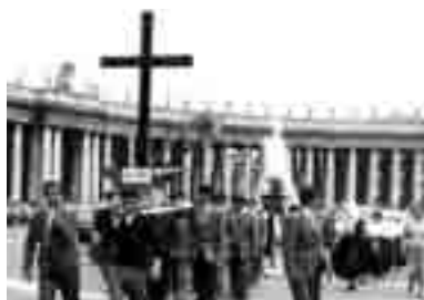
1° maggio 1955: Piazza San Pietro

In quella giornata memorabile per la storia delle Acli, Pio XII, pronunciò il seguente discorso: «(...) noi, vicario di Cristo, desideriamo altamente riaffermare, qui, in questo giorno del primo maggio, che il mondo del lavoro ha aggiudicato a sé come propria festa, con l'intento che da tutti si riconosca la dignità del lavoro e che questa ispiri la vita sociale e le leggi, fondate sull'equa ripartizione di diritti e di doveri. In tal modo, accolto dai lavoratori cristiani, e quasi ricevendo il crisma cristiano, il primo maggio, ben lungi dall'essere risveglio di discordie, di odio e di violenza è, e sarà, un ricorrente invito alla moderna società per compiere ciò che ancora manca alla pace sociale. Festa cristiana, dunque, cioè giorno di giubilo per il concreto e progressivo trionfo degli ideali cristiani nella grande famiglia del lavoro». L'anno successivo fu dato alla festa un carattere internazionale e arrivò da Milano, in elicottero, sul sagrato della basilica di San Pietro, una piccola statua di Cristo Lavoratore, come si vede anche nel film La dolce vita di Fellini.