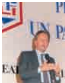
Referendum, Mario Segni alle Acli

Nel periodo successivo al Congresso di Roma sono soprattutto due gli obiettivi che le Acli intendono conseguire. Primo, gettare le basi di una nuova società civile capace di attraversare le sfide del moderno con una rinnovata cultura della promozione umana e della solidarietà; secondo, chiamare il civile a farsi soggetto politico in grado di spingere in avanti un serio processo di riforma delle istituzioni e del sistema politico. Concretamente le Acli si impegnano con molteplici iniziative per promuovere la riforma delle istituzioni, in particolare, prendendo parte alla spinta referendaria per la riforma del sistema elettorale.