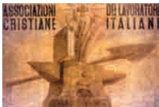
Primo simbolo delle Acli

Non sarà una ricostruzione scritta con i criteri delle scienze storiografiche, ma avrà un carattere "popolare" che selezionerà eventi e personaggi assumendo un taglio divulgativo e uno stile sobrio e veloce. Ogni pagina dell'inserto sarà accompagnata da documentazione fotografica. Ampio spazio sarà dato ai testi ormai "classici" e a quelli più recenti che ricostruiscono la storia delle Acli. Non ci prolunghiamo oltre anche per non rubare lo spazio - già breve - che abbiamo a disposizione. Buona lettura.