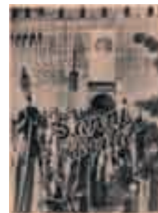
Manifesto per i primi cinque anni di vita delle Acli

A partire dal 1950 le Acli, dopo la nascita della Cisl, possono dedicarsi con maggior impegno alla loro missione educativa all'interno del movimento operaio. Vediamo così svilupparsi nuove iniziative come la costituzione dell'Enaip per attività di formazione professionale, l'organizzazione delle lavoratrici domestiche, dei convegni di studio e di spiritualità, dei servizi di Patronato per gli italiani all'estero. In questo modo viene sviluppandosi sempre di più la consapevolezza di essere "testimoni del Vangelo" nel movimento operaio.