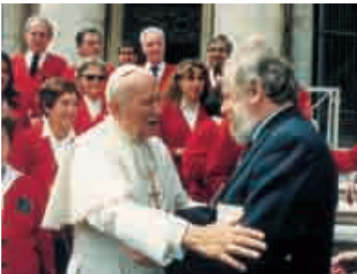
1° maggio 1995 Incontro delle Acli con Giovanni Paolo II

In questo discorso, Giovanni Paolo II delinea chiaramente le attese della Chiesa verso le Acli: priorità alla formazione, nuova cultura del lavoro, impegno per la costruzione di una società più giusta, libera e fraterna; dialogo sincero con gli altri protagonisti del mondo del lavoro.