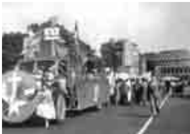
Corteo del 1° maggio 1955: dal Colosseo a San Pietro