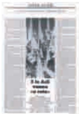
Una pagina di "Azione sociale" con gli intenti della Conferenza di Ischia