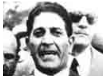
Giuseppe Di Vittorio