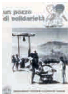
"Un pozzo di solidarietà", campagna Ipsia per l'Eritrea, 1987

Dopo la nascita dell'Entour (1980), Unapol (1981), Unasp (1982) e Cnala (1983), il 13 novembre 1985, viene costituito l'Ipsia (Istituto pace sviluppo innovazione Acli).